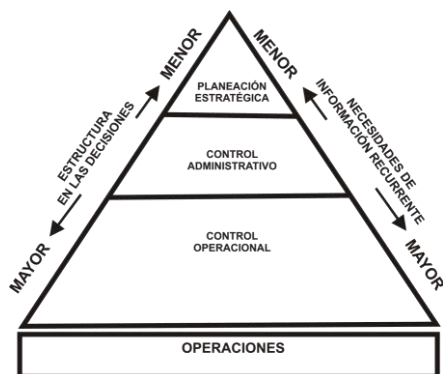
Figura 1. Relación entre sistema de información y los niveles de una organización.

Hoy en día, en la búsqueda por navegar de una forma más eficiente y cómoda dentro del proceso administrativo, surgen los sistemas de información como instrumentos de apoyo, Senn (1993) los define como un conjunto de componentes que interactúan entre sí para lograr un objetivo común, describe cómo los sistemas de información sirven de apoyo a los tres niveles de la pirámide organizacional, a nivel estratégico potencian las ventajas competitivas de la institución, a nivel táctico apoyan la toma de decisiones y a nivel operacional soportan la ejecución de los procesos transaccionales. Los sistemas de información llegan a las organizaciones como una herramienta estratégica, táctica y operacional para contribuir de manera positiva en la administración de la empresa (Véase figura 1).